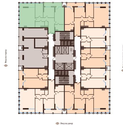
👁 Вид на улицу Нукус

Ko'rish: Shahar manzarasi / Nukus ko'chasi manzarasi